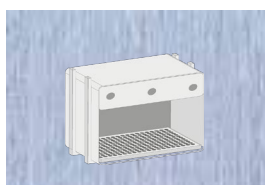
DANS UN CAISSON EN BOIS s'intègre dans un rayonnage

Hauteur : 540 mm Largeur : 810 mm Profondeur : 610 mm